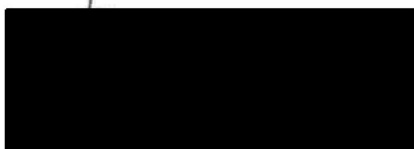
dyrektorka TR Warszawa

Nr 1 – Szczegółowe wymagania dla koncepcji inscenizacyjnej i projektu scenograficznego widowiska